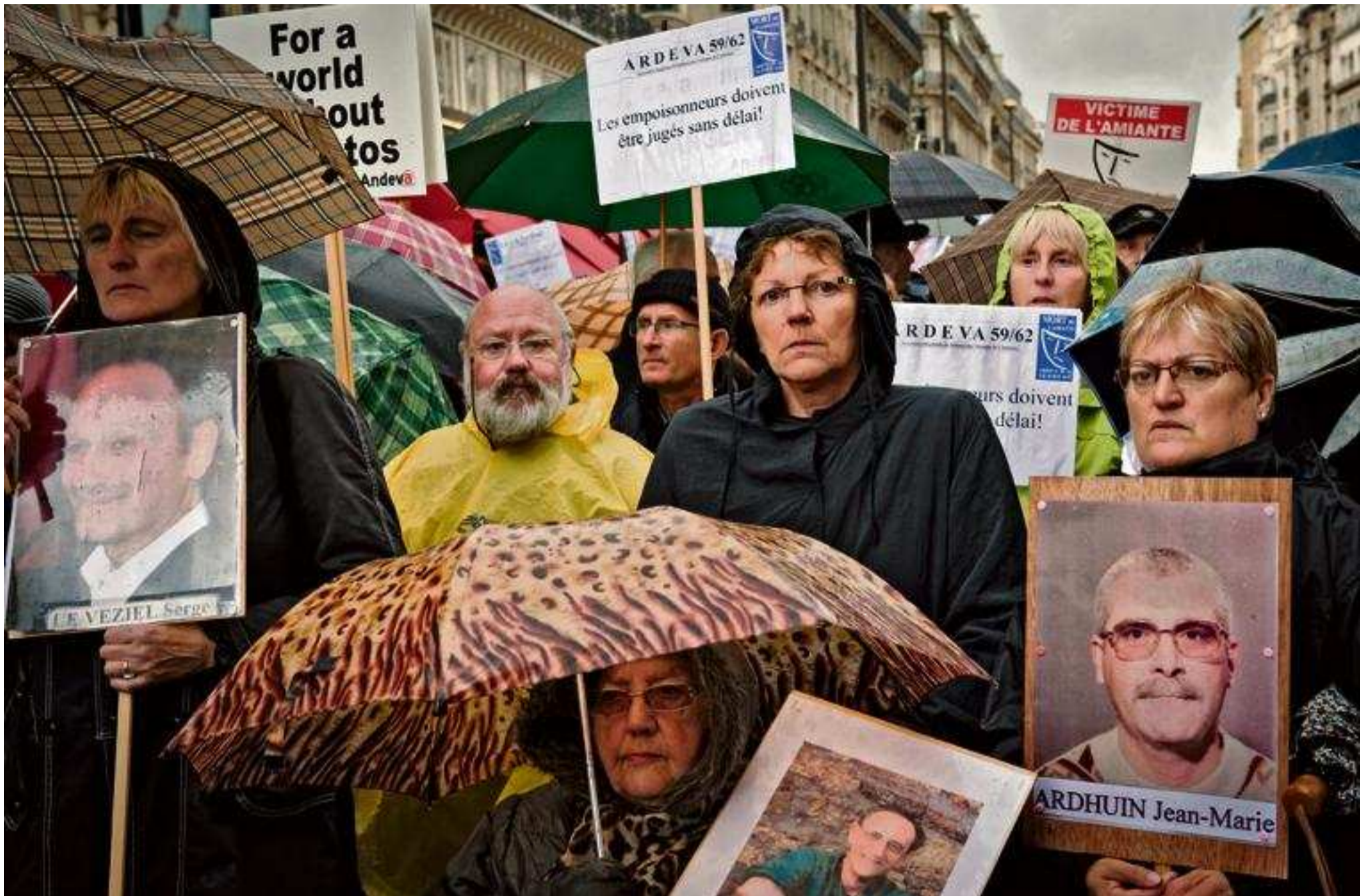
Manifestation de victimes de l'amiante, en octobre 2012, à Paris.