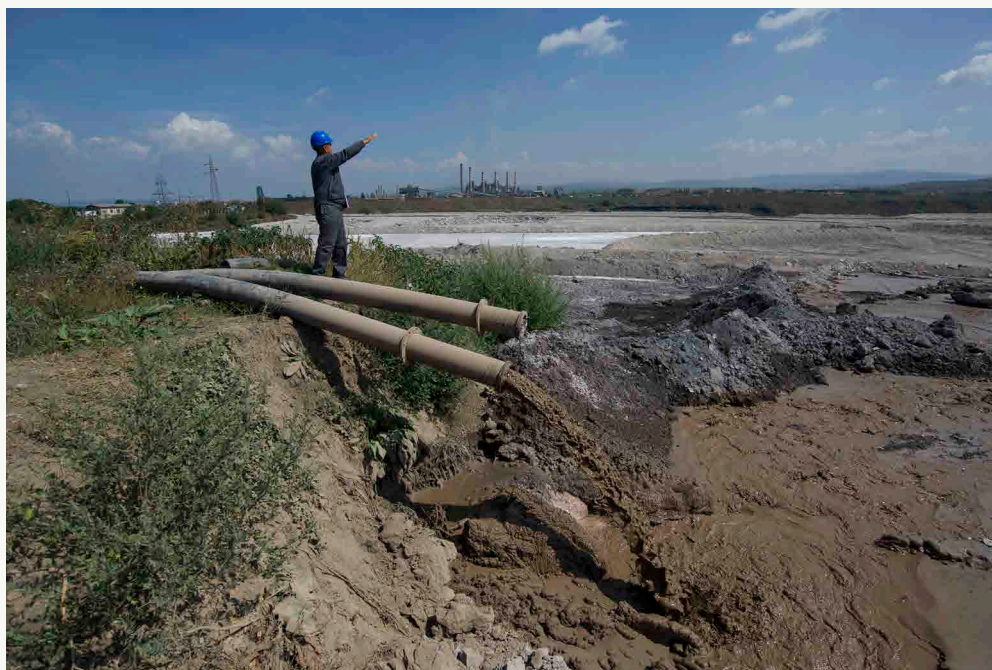
Un travailleur nous montre le système de décharge de cendres hydroélectriques lors de la visite sur le site de Mirash/Obilic.