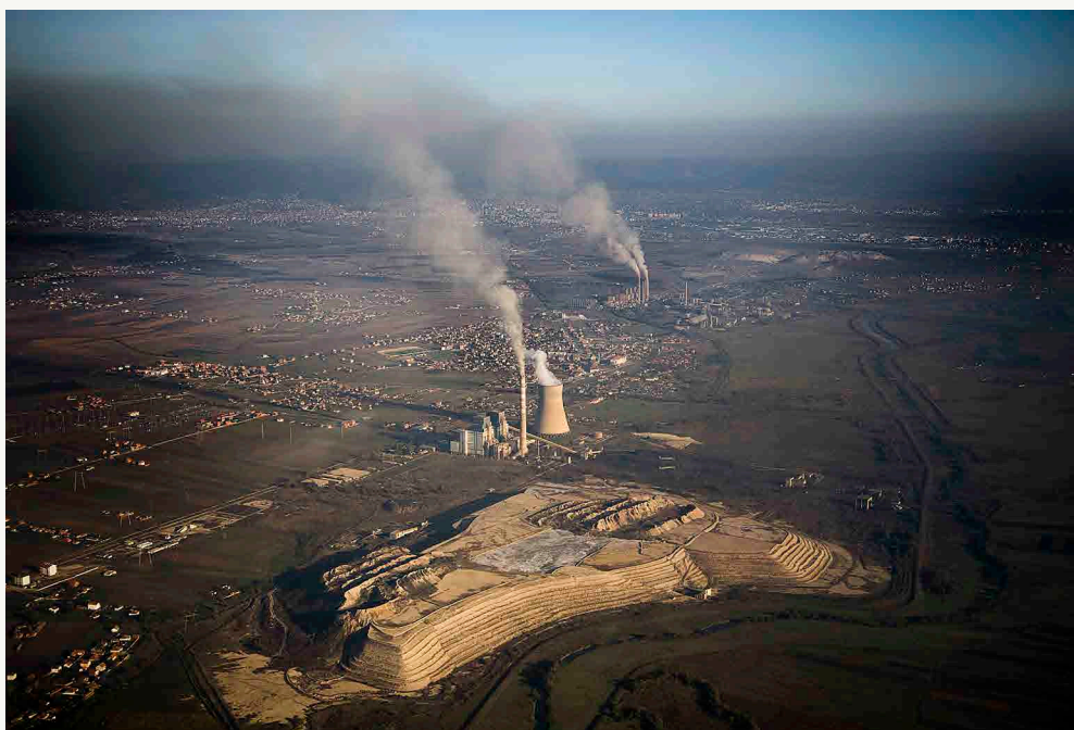
Vue topographique de Kosovo A et B à Obilic.

"S'agit-il d'une malédiction ou d'une bénédiction pour le Kosovo?", se demande Ismail. Toutefois, lorsqu'il repense à sa carrière professionnelle, il est satisfait, car il l'a passée dans une entreprise offrant des