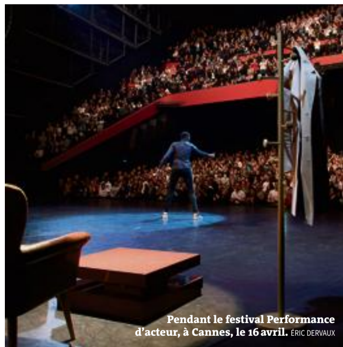
Pendant le festival Performance d'acteur, à Cannes, le 16 avril.

SUR SCÈNE, sur les plates-formes numériques telles que YouTube, ou dans les émissions de télévision et de radio, les humoristes s'affichent partout et n'ont jamais été aussi nombreux. La catégorie humour est aujourd'hui la plus