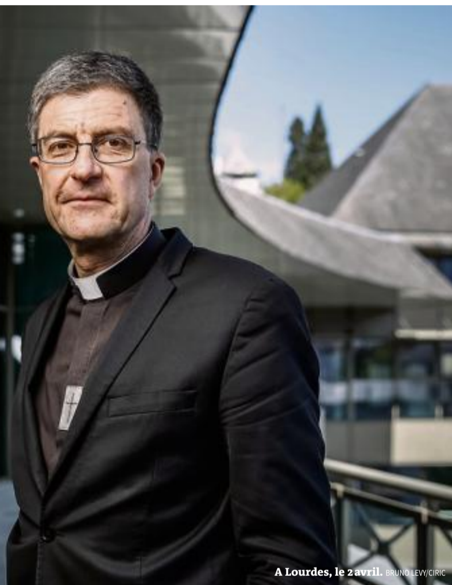
A Lourdes, le 2 avril.